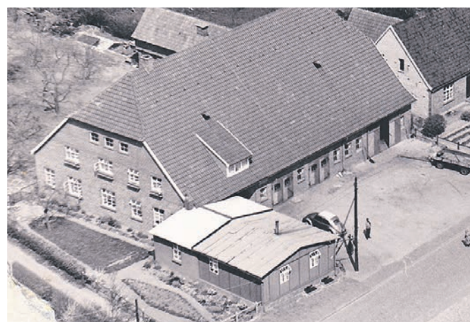
Stammhaus in den 50er Jahren